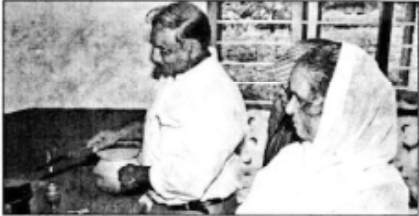
എല്ലാം അങ്ങനെ പൊതുവായി നവംബർ 5 നു പാൽ തിളപ്പിക്കൽ ശുശ്രൂഷ തീർപ്പാക്കുന്നു.